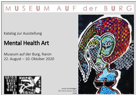
Im Rahmenprogramm der Wölfli-Ausstellung sollen u.a. auch Werke von Künstler*innen der Kunstwerkstatt Waldau Bern gezeigt werden...