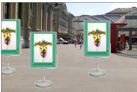
Der Bahnhofplatz neben dem Baldachin und der Heiliggeistkirche ein idealer Ausstellungsort in Corona-Zeiten.