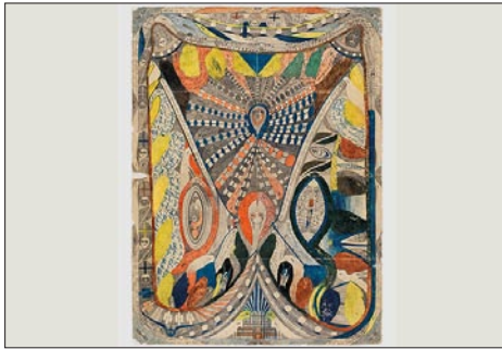
Adolf Wölfli-Ausstellung vom 21.5.-15.8.2021, (Paris=Spinne, 1909/10, Bleistift und Farbstift auf Papier)